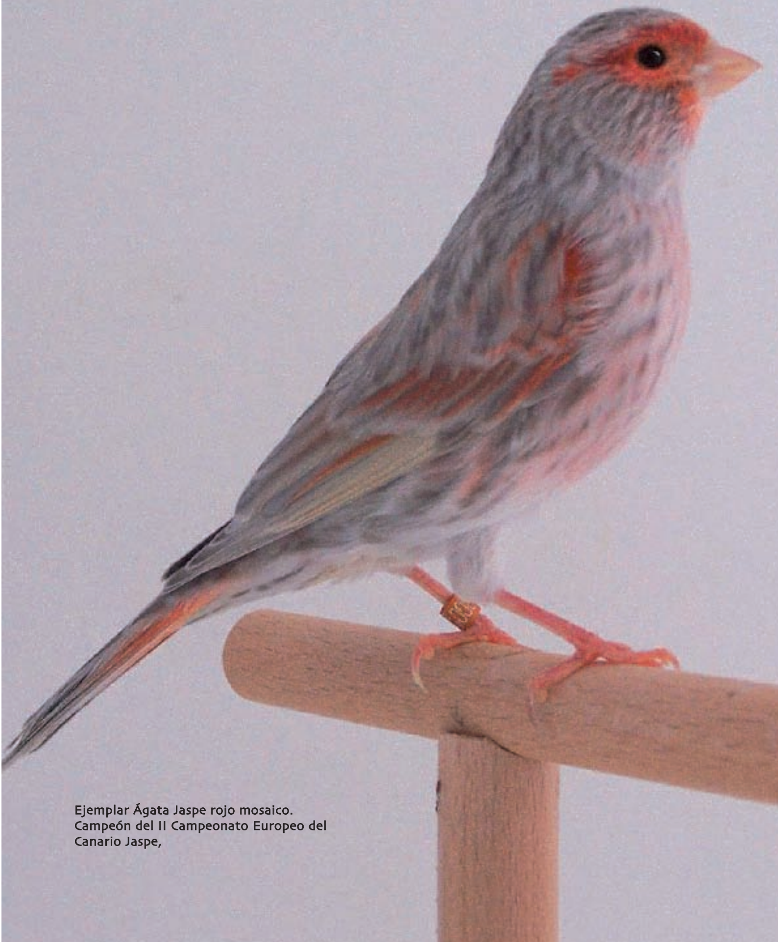
Ejemplar Ágata Jaspe rojo mosaico. Campeón del II Campeonato Europeo del Canario Jaspe,