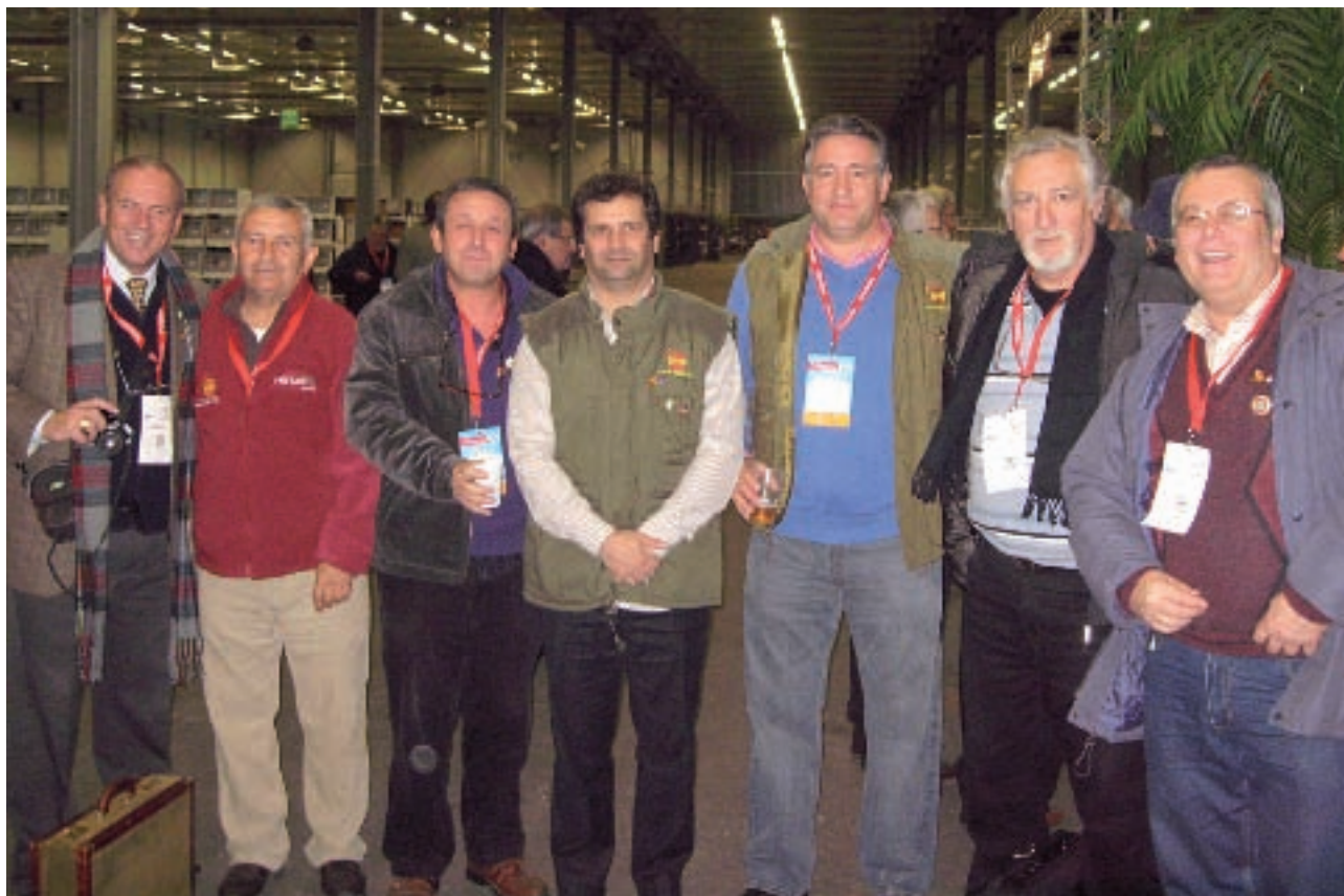
Grupo de españoles celebrando el reconocimiento de la Variedad Jaspe SD.