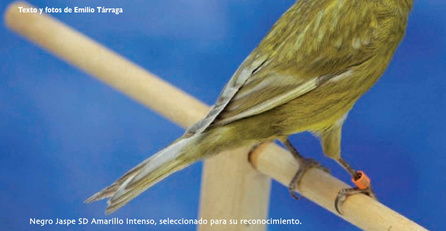
Negro Jaspe SD Amarillo Intenso, seleccionado para su reconocimiento.