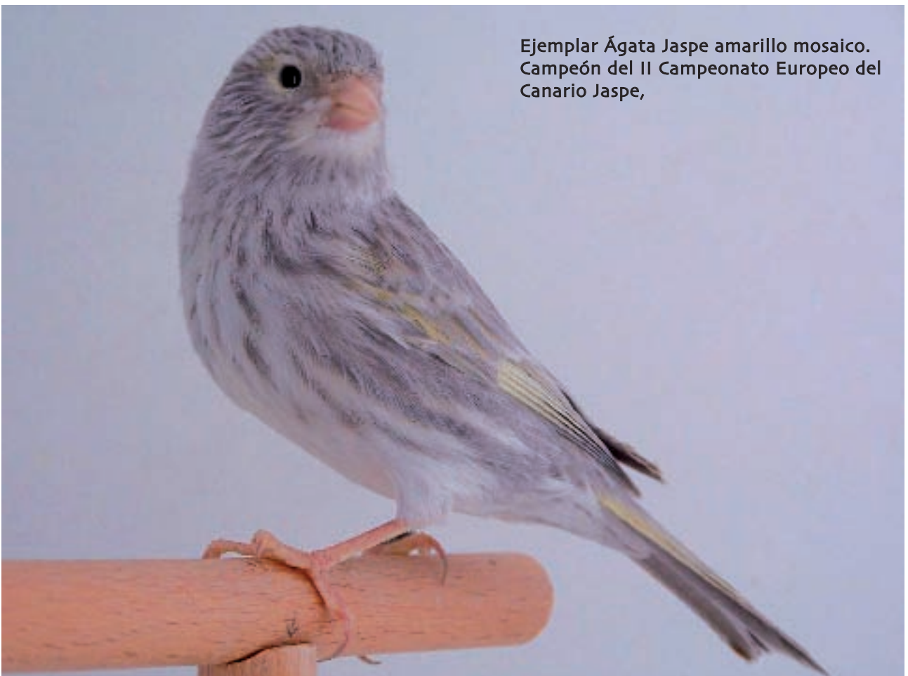
Ejemplar Ágata Jaspe amarillo mosaico. Campeón del II Campeonato Europeo del Canario Jaspe,

Como estaba previsto el día 25 martes la OMJ-COM realizó los enjuiciamientos de los ejemplares que habíamos seleccionado para el reconocimiento mundial de la variedad de canarios de color Jaspe SD, cinco colegiados de Bélgica, Francia, Italia, Holanda y Eslovenia que fueron seleccionados por el presidente de OMJ-Color Roberto Rossi para tan importante labor, otorgando estos una elevada puntuación a los