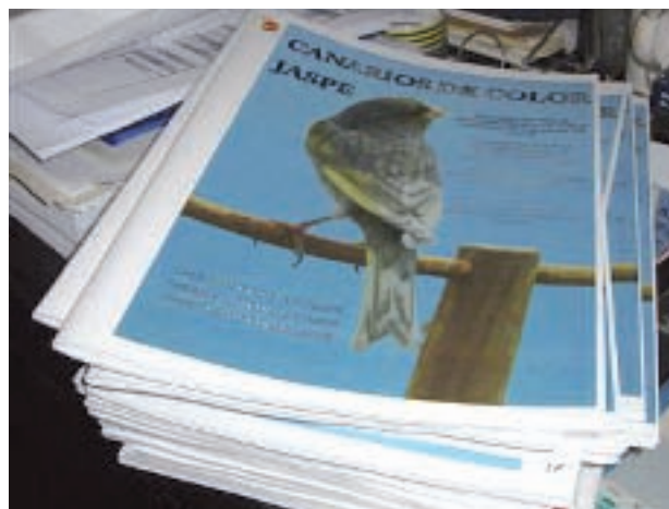
Detalle del documento editado para la OMJ- COM.

sobre antecedentes, características típicas de la variedad, estándar e imágenes actuales de los distintos fenotipos JASPE.