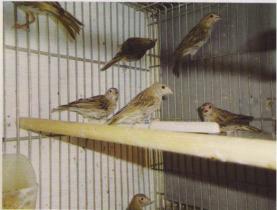
Sicalis Flameola noveles.

Alimentación que les doy, Pasta Comercial especial de Fauna Europea humedecida con Rust, gusanos de la Harina en época de cría , Mixtura que yo mismo les preparo 50% alpiste, mijo amarillo 20% mijo blanco 10% negrilla 5% de avena y 5% de perilla, el gril y el agua limpia y fresca y cambiarla a diario. No he utilizado ningún tipo de vitamina de celo ya que los machos son bastantes fogosos, el calibre que he utilizado es de 2,9 mm.