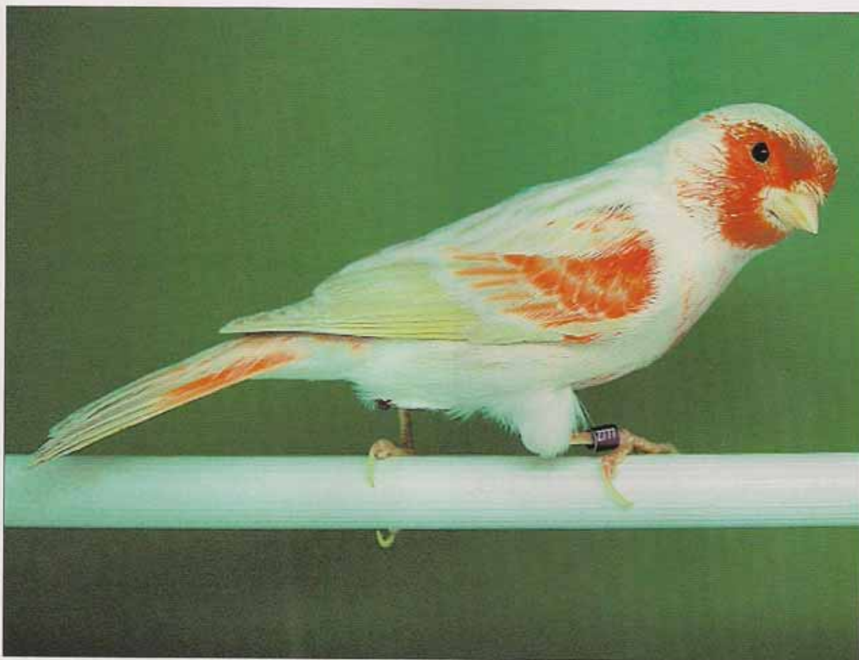
Macho Satiné Rojo Mosaico. Podemos apreciar que las plumas de la cola están pigmentadas, por lo que será penalizado en el apartado de categoría. Según el estándar del CJA.

peratura ambiental en el momento que lavamos los pájaros, ya que corremos el riesgo de que mueran por hipotermia. Yo aconsejo meterlos unos minutos en una jaula enfermería hasta que se hayan secado el plumaje. El lavado del plumaje del pájaro nunca debe hacerse el mismo día o el día previo al concurso, sino varios días antes, ya que una vez el plumaje está limpio, necesitará de unos días para que éste adopte una perfecta posición, brillo y adherencia al cuerpo.