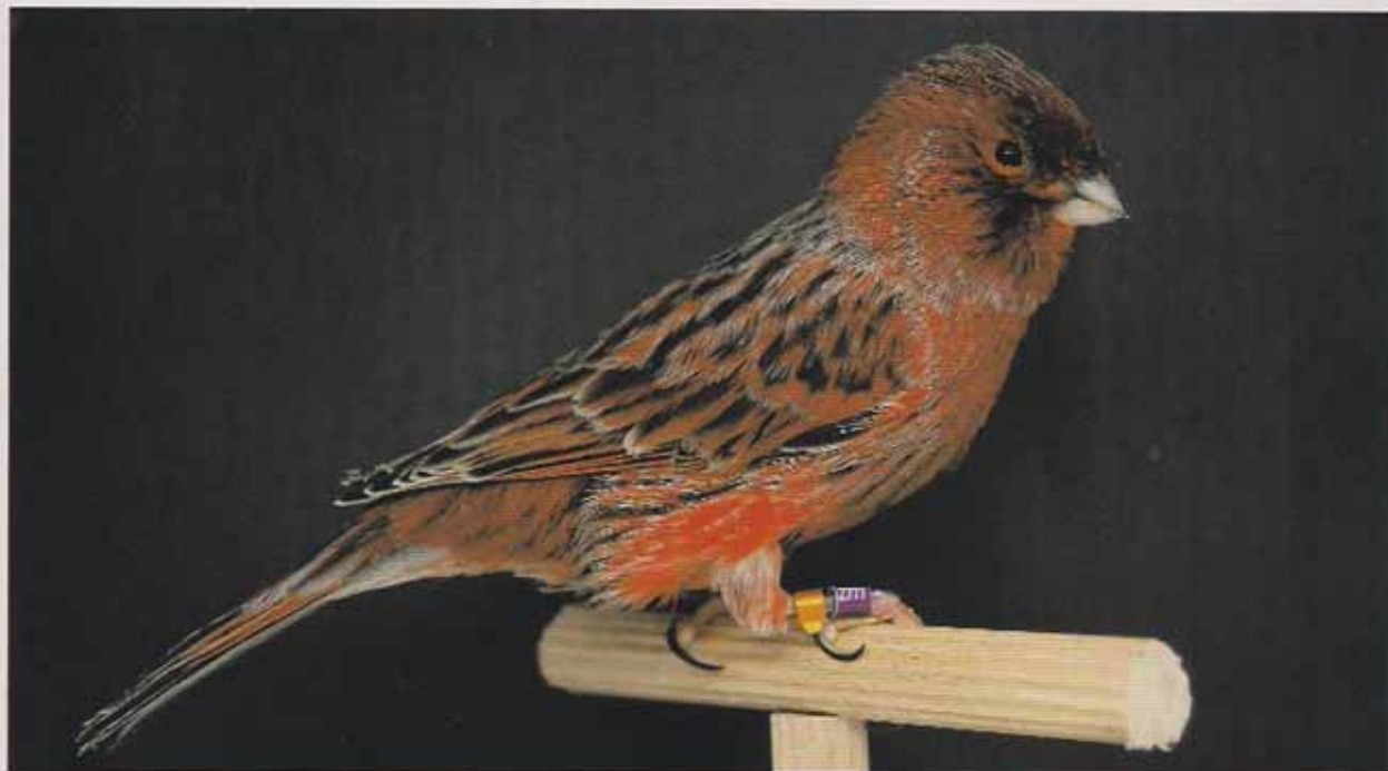
Macho Negro rojo nevado. En el que podemos apreciar un buen lipocromo y una buena distribución de la nevadura, si bien acumula demasiada alrededor del cuello. Tiene una buena talla y forma. El pájaro adopta una correcta posición. Falta oxidación en partes córneas y un diseño dorsal y en flancos más ancho.

En los canarios lipocromos supone la descalificación del ejemplar la presencia de manchas melánicas en cual-