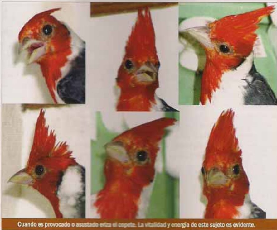
Cuando es provocado o asustado eriza el copete. La vitalidad y energía de este sujeto es evidente.