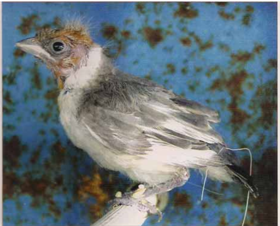
Bonito polloleto de 19 días. Aún no se aprecia el copete. Véase la dilución alar anómala.