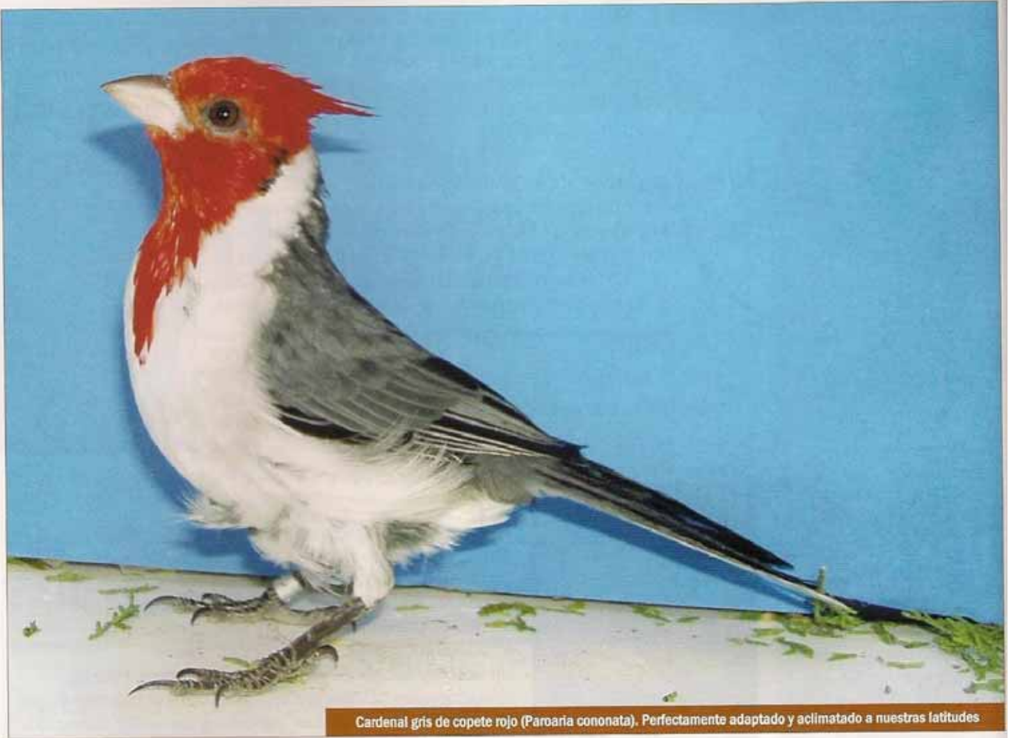
Cardenal gris de copete rojo ( Paroaria cononata ). Perfectamente adaptado y aclimatado a nuestras latitudes