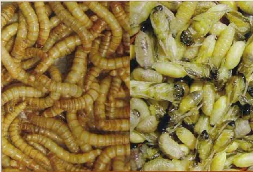
Los insectos (gusanos de harina y otras larvas), en los 10 primeros días, han sido la clave para sacar los polluelos.

la flora intestinal) adecuado y un complemento biológico, vitamínico y mineral necesario para equilibrar la alimentación de los pájaros reproducidos en criadero. Periódicamente y sobre todo durante los primeros 10 días de vida, cuando son separados de los padres y durante la muda, añade a la pasta un tratamiento antibiótico y vitamínico para evitar procesos infecciosos.