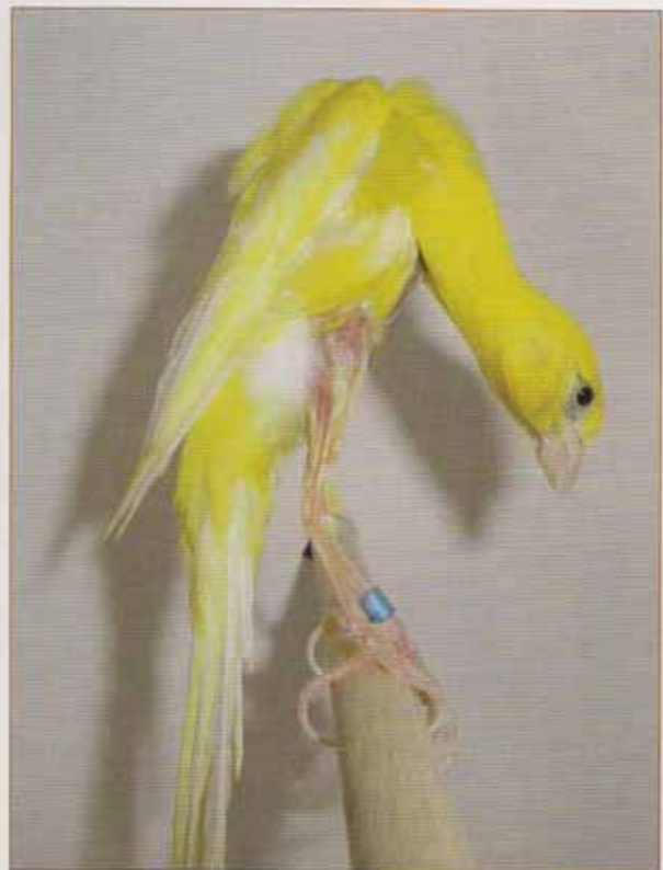
Componente del equipo subcampeón del mundo Piacenza 09.

Para mí los 6-7 primeros días, es decir, hasta que los anillemos, los considero los más peligrosos o propensos a encontrarnos dentro del nido algún pichón muerto y sin explicación aparente, pero como he comentado es la ley de la naturaleza. Desde que anillamos a los ejemplares, ya se puede estar más seguro de que el ejemplar seguirá adelante, pero hasta ese momento yo por lo menos no estoy seguro de que vaya a sobrevivir. A mí me ayuda bastante el empapuzarlos cada hora, (exceptuando las horas en las