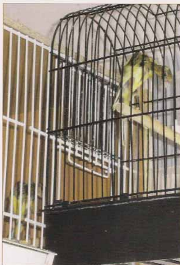
Jaula de concurso acoplada a la voladera.