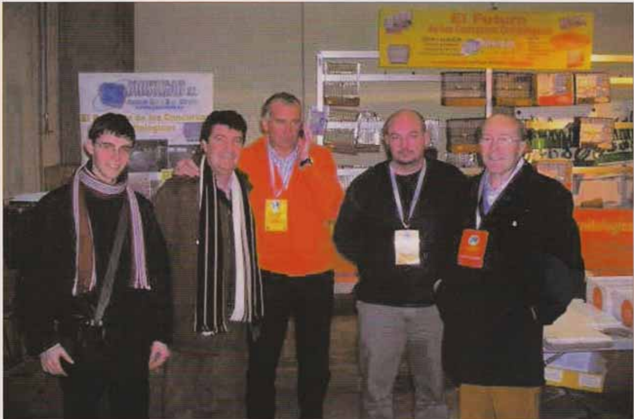
Aficionados al Giboso Español en el Mundial de Piacenza. Delante del Stand comercial de Justicab.

Si se quiere tener una buena cría es recomendable tener el doble de parejas de nodrizas que de parejas de Giboso se vayan a emparejar. Yo normalmente no suelo destinar parejas exclusivamente como nodrizas, pues al tener más variedades en el aviario (con las cuales también compito) con excelentes cualidades reproductoras no tengo problemas. Suelo utilizar el Fife Fancy, el LLarguet Español, y el Moña Alemana como nodrizas de mis Gibosos.