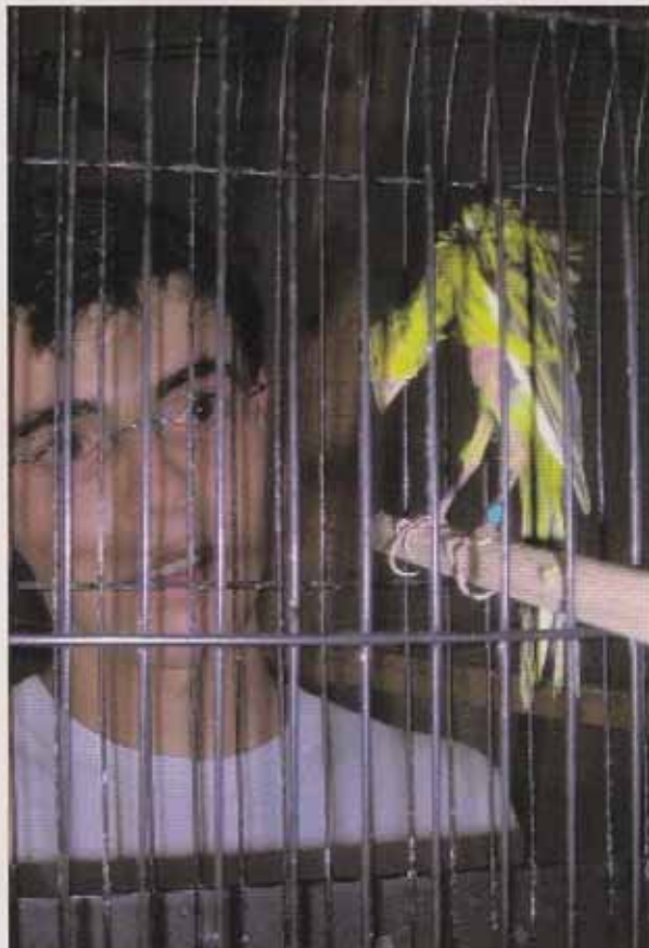
El criador observando las virtudes y los defectos.

Hasta antes de la cría a los Gibosos les suministro una alimentación basada fundamentalmente en alpiste y perilla, pero cuando se acerca el período de cría les empiezo a suministrar gradualmente mezclado con el alpiste y la