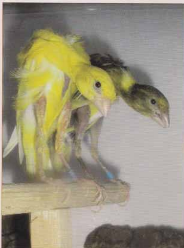
Pareja de reproductores.