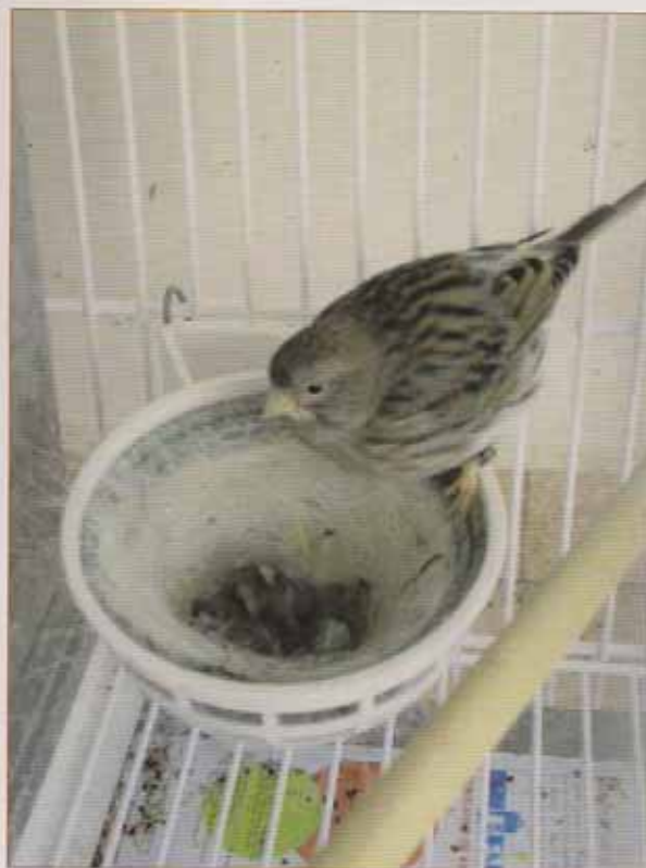
Hembra de Fife Fancy desempeñando la labor de nodriza de una camada de Gibosos verdes.

Una vez formadas las parejas, divido cada jaula de metro en tres partes (medio metro en el centro donde serán alojadas las dos hembras y en los 25 centímetros que quedan a cada lado coloco a los dos machos). Durante una semana les coloco el separador de chapa para que se oigan pero no se vean y a la semana ya les coloco el separador de rejilla. Utilizo este método porque así los dos machos se ven entre ellos y ven a las dos hembras y ponen más esfuerzos en cortejarlas. Además de las parejas que destinaré a la reproducción, siempre suelo guardarme de reserva algún macho y alguna hembra (intensos y nevados) por si se diera el supuesto de que se muriera alguno de los que está en reproducción. No tengo un número fijo de parejas para poner en reproducción todos los años, unos años pongo más, otros años menos dependiendo de la cría del año anterior y de la calidad de los sujetos de que dispongo. Normalmente suelo poner entre 20-30 parejas de Gibosos. Pero siempre tengo presente que más vale poner pocas parejas pero bien seleccionadas que muchas y mal seleccionadas pues mi finalidad es la competición no la venta. Algo que no recomiendo a nadie en esta raza es poner un macho con dos hembras o ir pasando machos a diferentes hembras, ya que no suele funcionar bien en esta raza, más que nada, porque es un pájaro que se estresa con facilidad, y con un carácter un tanto peculiar.