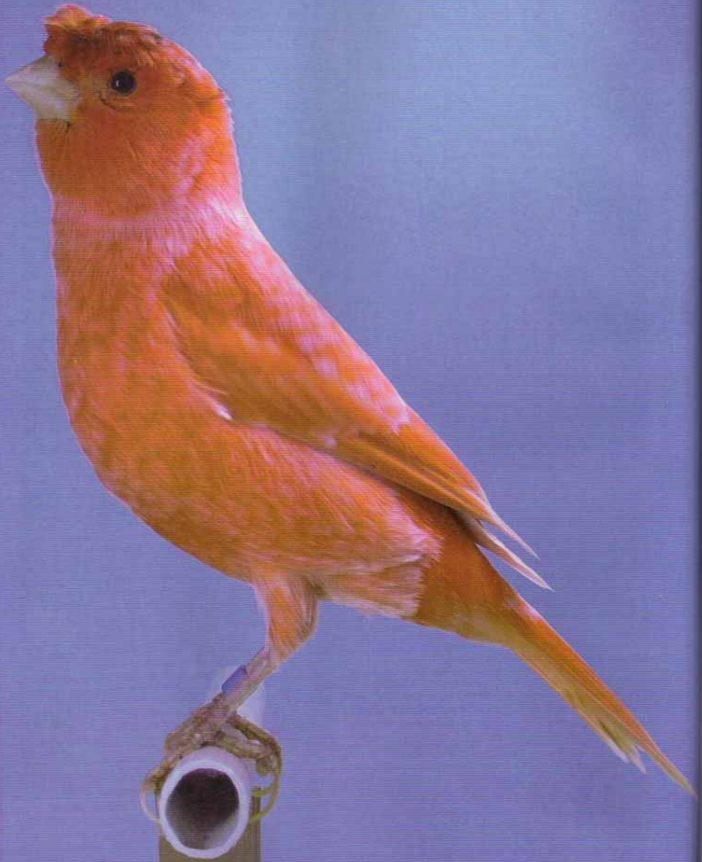
Magnífico ejemplar de Moña Alemana.