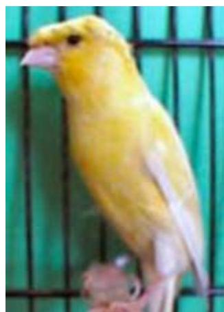
Dos vistas del Rheinländer corona