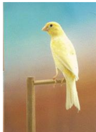
Rheinländer plaine o consort