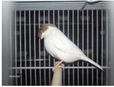
Gloster corona lipocrómico