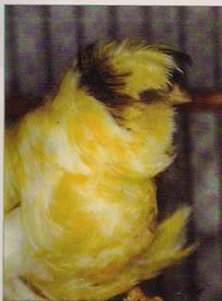
Gigante Italiano. Cabeza en forma de capucha completa

Se trata de un canario con más de 100 años de antigüedad, que se criaba exclusivamente en la isla de Tenerife, que no tenía unas características muy definidas, que imponían los aficionados según sus gustos personales y que se cree era producto del cruce entre otro canario rizado existente en la isla de origen desconocido con el también antiguo Scotch Fancy.