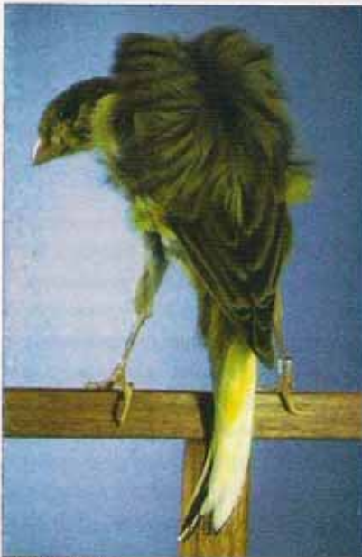
Rizado del Sur