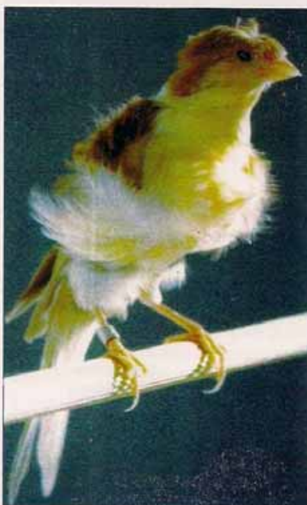
Fiorino con moña

En la década de los 80, los franceses que pretendían la paternidad de la raza, le cambian el nombre por el de Rizado Francés. Ante las quejas de otros países, la COM en la Reunión Técnica de la OMJ en Porrentruy (Suiza) de 1991, ordena la restitución de su antiguo nombre de Rizado del Sur, en refe-