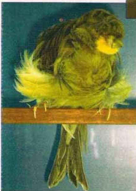
Rizado de París