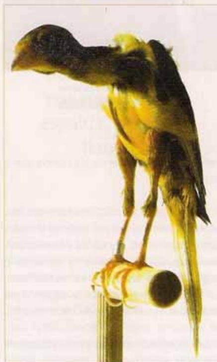
Gibber Italicus