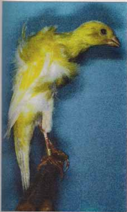
Rizado del Sur

La última raza reconocida hasta ahora por la COM ha sido la española del Melado Tinerfeño