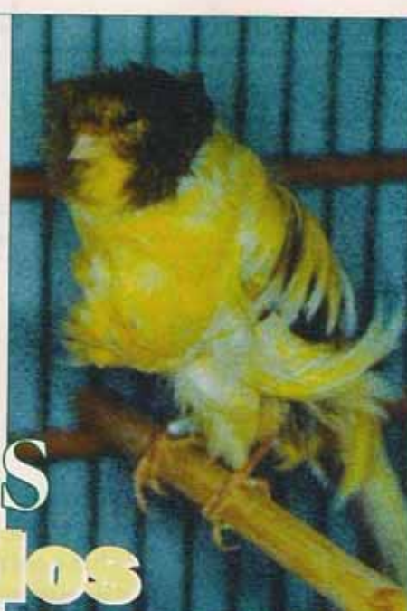
Rizado Gigante italiano