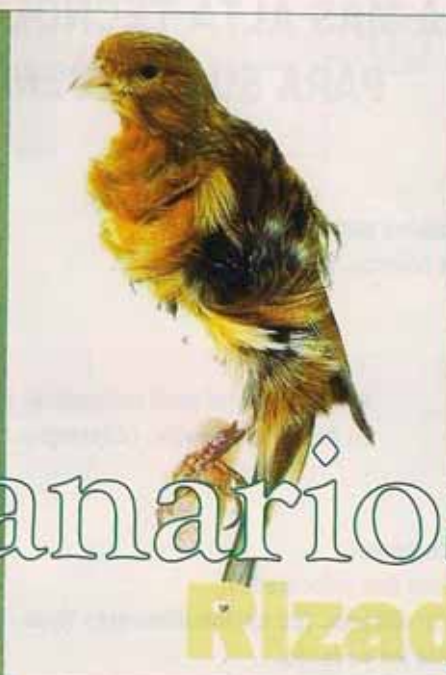
Rizado Suizo