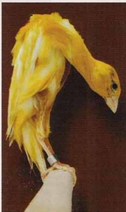
Giboso Español

En 1984 la COM reconocía en el Mundial de Pirmasens (Alemania) al Giboso Español. La idea de su creación se fraguó en Sevilla sobre 1970 y los trabajos se ini-