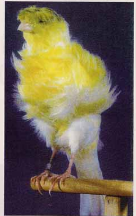
Padovano con moña

En el mundial de 2001 celebrado en Portugal se reconoció como raza el Rizado Gigante Italiano