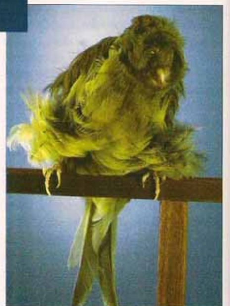
Rizado Gigante Italiano