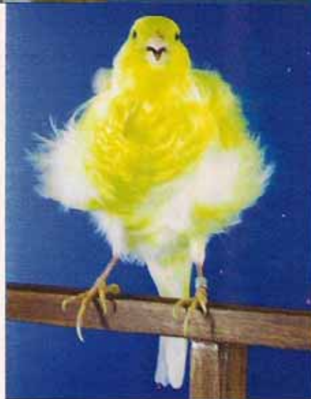
Rizado del Norte